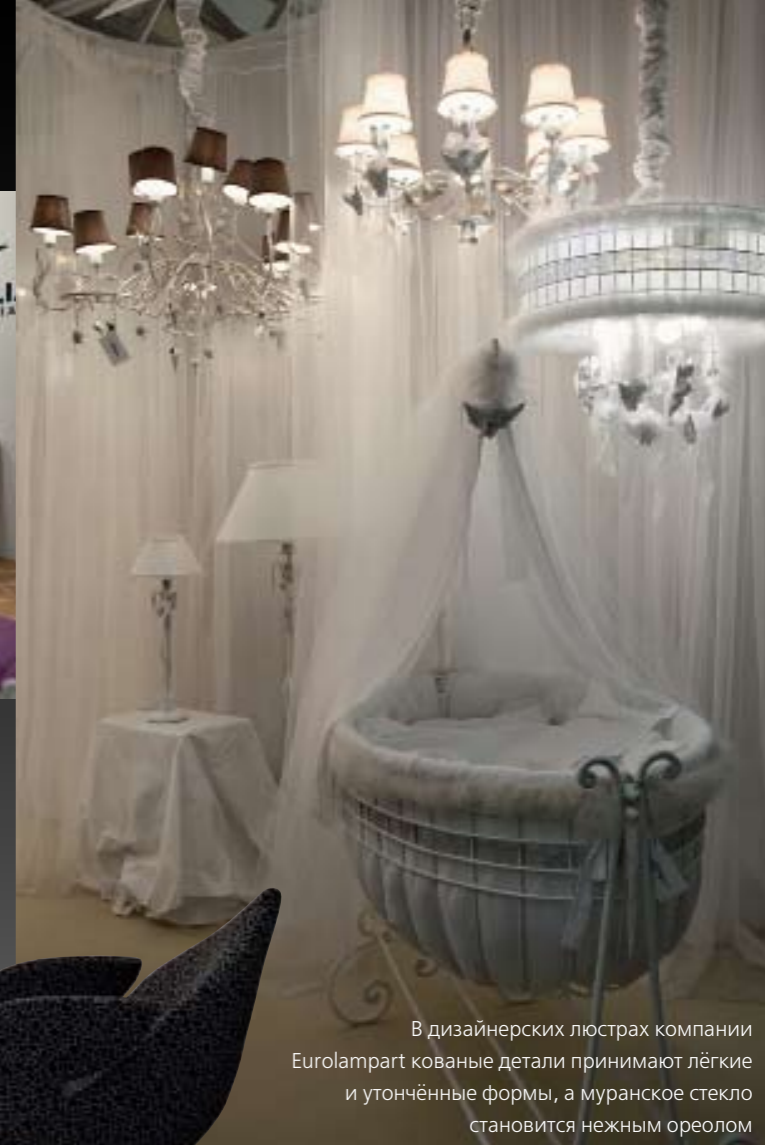
В дизайнерских люстрах компании Eurolampart кованые детали принимают лёгкие и утончённые формы, а муранское стекло становится нежным ореолом