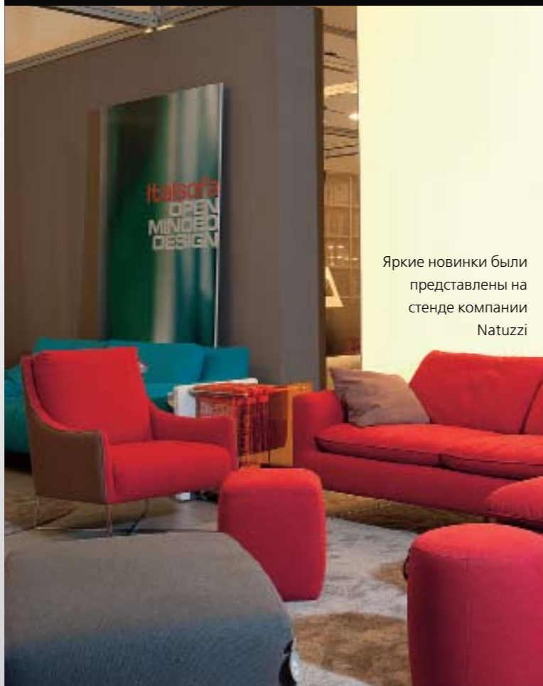
Яркие новинки были представлены на стенде компании Natuzzi