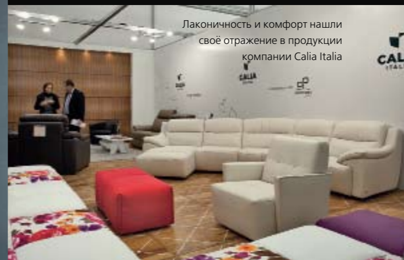
Лаконичность и комфорт нашли своё отражение в продукции компании Calia Italia