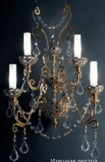
Изыщная люстра компании Masiero