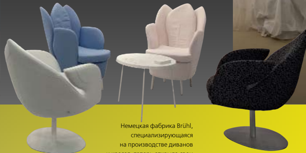
Немецкая фабрика Brühl, специализирующаяся на производстве диванов и кресел, теперь открыла свои салоны в Москве